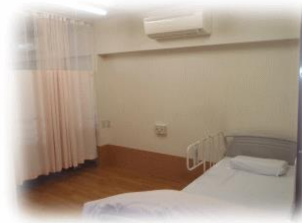
※居室イメージ（4人部屋の一室となります）

利用者の所得に応じて、市町村が決めた額（負担金）と、所定の利用者負担額をお支払い頂きます。（詳しくはお問い合わせください）